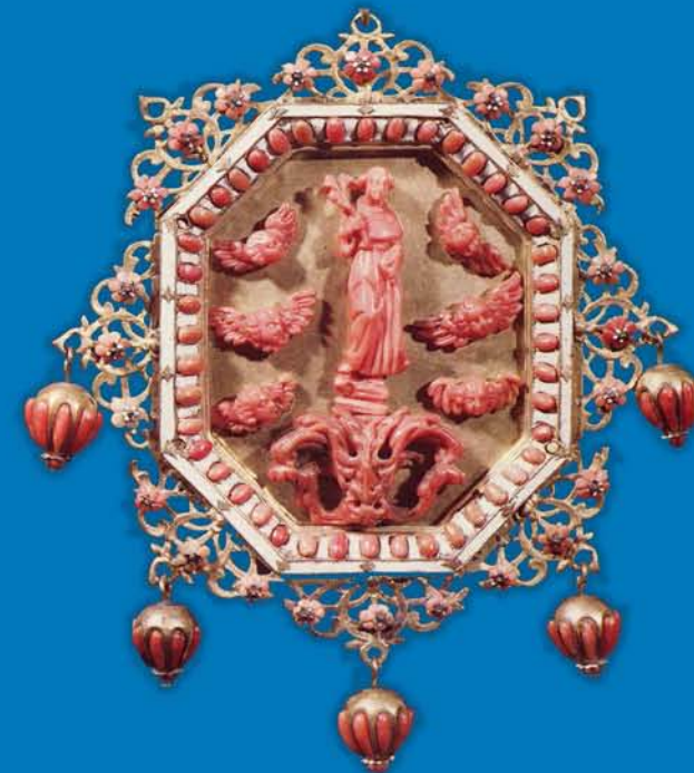
Capuzzale con S. Antonio - Maestranze trapanesi (prima metà del sec. XVII) - Roma, Collezione Volpe