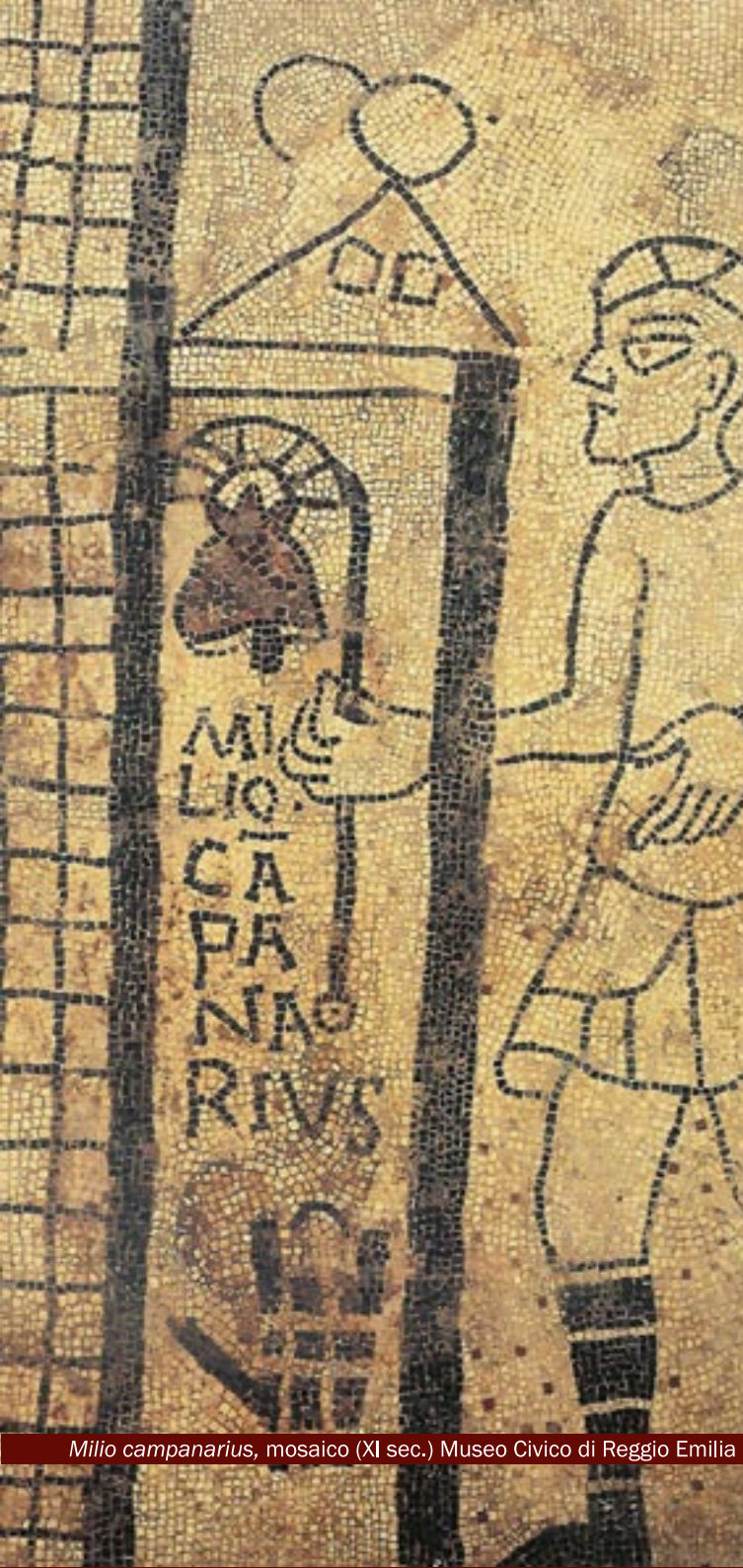
Milio campanarius, mosaico (XI sec.) Museo Civico di Reggio Emilia